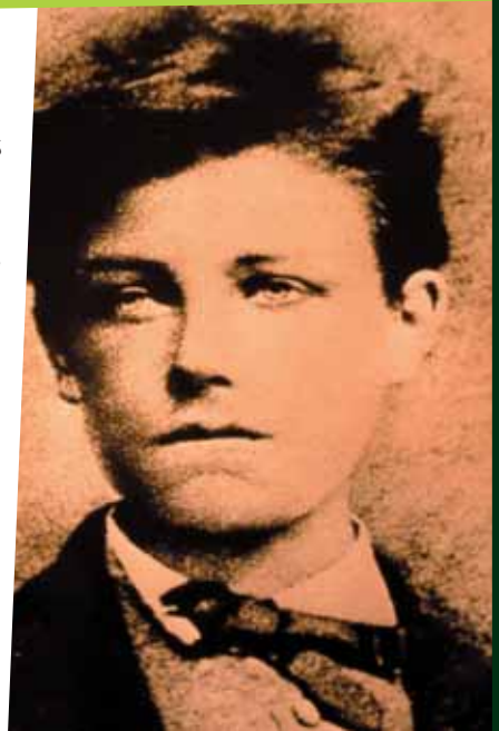
Arthur Rimbaud www.rimbaud-arthur.fr

Bienvenue en Ardennes. Et regardez bien où vous posez les pieds. Sous chaque pierre guette une légende !