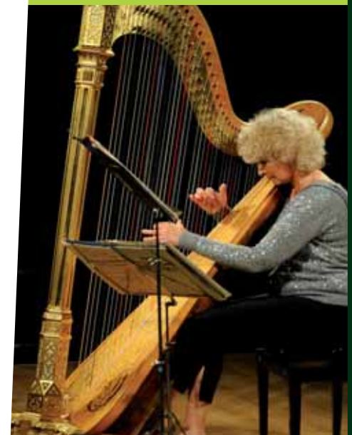
22-24 et 28-30 Mai, Argonnes Notes d'Argonne Tél.: 03 24 71 97 57

La 7ème édition du festival de musique « Notes d'Argonne » se prépare ainsi à célébrer une nouvelle fois ce pays à la forte identité avec son traditionnel festival de musique classique. Les concerts se déroulent du 22 au 24 et 28 au 30 Mai avec une programmation très diversifiée mettant à l'honneur des artistes de renommée internationale se produisant dans un cadre architectural remarquable. Six concerts en tout dédiés aux trois Argonnes : meusienne, marnaise et ardennaise.