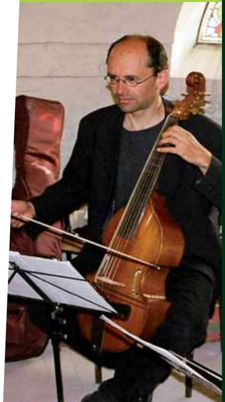
26/27 Juin, Asfeld Festival Viole de Gambe www.violedegambe.org

Mais où est donc Asfeld ? Sur une petite route de campagne qui longe l'Aisne, à 150 kilomètres de Paris. C'est ici qu'en 1680 (Versailles est en chantier) Jean-Jacques de Mesmes, comte d'Avaux, confie la réalisation d'une nouvelle église au frère dominicain François Romain, un génial architecte à qui il recommande de concevoir un monument qui soit à la fois lieu de culte et instrument de musique. Le résultat est pour le moins original. Bâtie en briques, l'église à la facture insolite que l'on sait, ponctuée à l'intérieur de colonnades d'inspiration italienne, est devenue le rendez-vous d'un festival de viole de gambe, instrument sacré que le public français a découvert grâce au film à grand succès « Tous les matins du monde ». Rendez-vous en juin 2010 pour la 5ème édition de cette manifestation pas comme les autres où l'instrument musical est à la fois contenant et contenu.