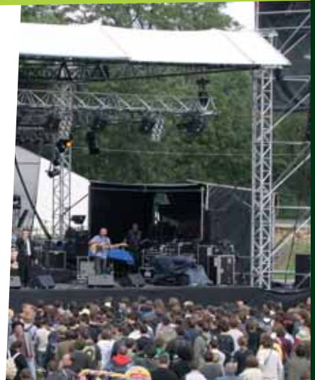
27-29 Août, Charleville-Mézières Festival du Cabaret Vert www.cabaretvert.com

En 2009 déjà l'événement avait galvanisé plus de 40 000 festivaliers venus acclamer des virtuoses du métal, du ska, du slam ou du reggae ou quelques groupes mythiques comme Deftones ou encore pour un public familial le dimanche Pierre Perret.