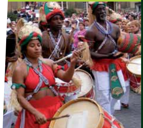
5/6 Juin, Charleville-Mézières Tambours de Fête Tél.: 03 24 57 92 85 www.tamboursdefete.com

Les enfants, bien sûr, seront les convives privilégiés de la manifestation qui concocte toujours à leur intention des activités pédagogiques ou des ateliers à thème comme la fabrication d'instruments de musique. Encadrés par de véritables artistes en la matière, les bâtons de pluie, calimbas, maracas, xequerés et autres cuicas ou berimbaus n'auront plus de secrets pour vos « graines de percus ».